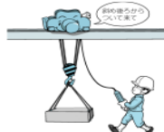
床上操作式クレーン