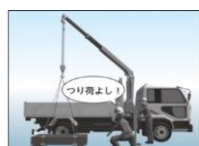
小型移動式クレーン