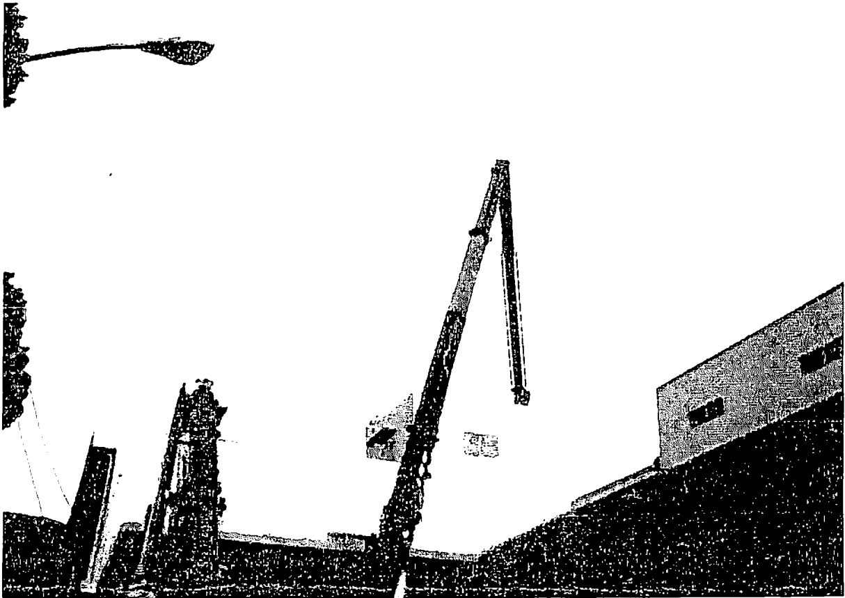
ジブが折損した移動式クレーン

移動式クレーンの主ジブを倒してフックを当該ダクトの真上に持ってきて2本のベルトスリングにより玉掛けをし、フックを巻き上げたところ過負荷防止装置が100%に達したため、その状態で旋回して荷を30~40cm程度ずらした。その後引き続いて移動式クレーンにより横取りすることとし、ジブを起こしながら巻き上げ用ワイヤロープを延ばす操作を7~8回繰り返しながら搬出場所付近まで3m程移動したところで（その位置での作業半径31.6m~35.1m、定格荷重0.95t~0.85t）ジブを起こした時、荷が少し屋上より浮いた状態となり、その瞬間、当該クレーンの第5ジブが折れ曲がり始めて先端の補助ジブが屋上に激突した。