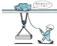
床上操作式クレーン