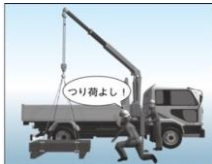
小型移動式クレーン