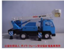
高所作業車運転技能講習開始