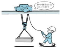
床上操作式クレーン