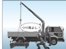
小型移動式クレーン